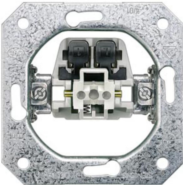
DELTA TASTER-GERAETEEINSATZ, UP 1SCHLIESSER, 10A 250V