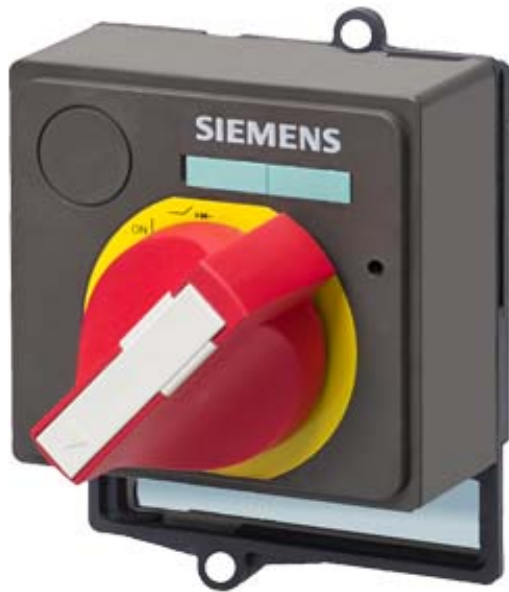
ZUBEHOER FUER VL630, VL800, FRONTDREHANTRIEB NOT-AUS, ROT/GELB