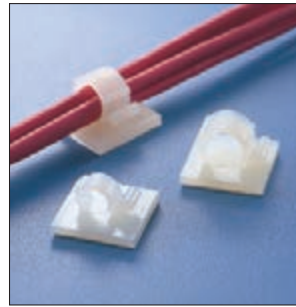
Befestigungssockel RA-Serie - schnelle Montage durch einfache Handhabung.