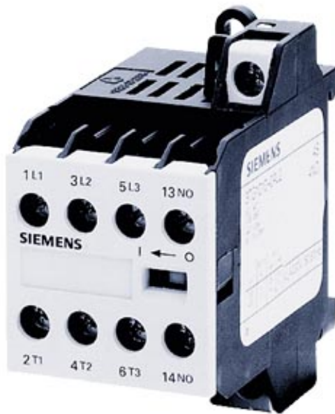
MOTORSCHUETZ EKS 4S WECHSELSTROMBETAETIGUNG AC 24V, 45...450HZ MIT SCHRAUBANSCHLUSS