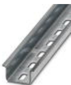
Tragschiene, Material: verzinkt, gelocht, Höhe 15 mm, Breite 35 mm, Länge: 2 m

Tragschiene gelocht - NS 35/15 ZN PERF 2000MM - 1206599