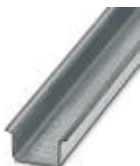
Tragschiene, Material: verzinkt, ungelocht, Höhe 15 mm, Breite 35 mm, Länge: 2 m

Tragschiene ungelocht - NS 35/15 ZN UNPERF 2000MM - 1206586