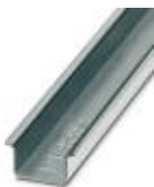
Tragschiene 35 mm (NS 35)

Tragschiene - NS 35/15 WH UNPERF 2000MM - 1204135