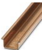
Tragschiene, Material: Kupfer, ungelocht, 1,5 mm dick, Höhe 15 mm, Breite 35 mm, Länge: 2 m

Tragschiene ungelocht - NS 35/15 CU UNPERF 2000MM - 1201895