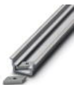
Tragschiene, profil-gezogen, hohe Ausführung, ungelocht 1,5 mm dick, Material: Aluminium, Höhe 15 mm, Breite 35 mm, Länge 2000 mm

Tragschiene ungelocht - NS 35/15 AL UNPERF 2000MM - 1201756