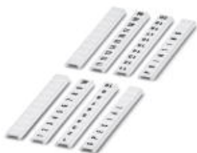
Zackband flach, 10-teilig, längs bedruckt mit den fortlaufenden geraden Zahlen: 42 ... 60, weiß

Bitte beachten Sie, dass die hier angegebenen Daten dem Online-Katalog entnommen sind. Die vollständigen Informationen und Daten entnehmen Sie bitte der Anwenderdokumentation. Es gelten die Allgemeinen Nutzungsbedingungen für Internet-Downloads. ( http://phoenixcontact.de/download )