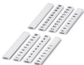
Zackband flach, 10-teilig, quer bedruckt mit den fortlaufenden Zahlen: 1 ... 10, weiß

Bitte beachten Sie, dass die hier angegebenen Daten dem Online-Katalog entnommen sind. Die vollständigen Informationen und Daten entnehmen Sie bitte der Anwenderdokumentation. Es gelten die Allgemeinen Nutzungsbedingungen für Internet-Downloads. ( http://phoenixcontact.de/download )