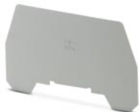
Abteilungstrennplatte, Länge: 72 mm, Breite: 0,8 mm, Farbe: grau

Bitte beachten Sie, dass die hier angegebenen Daten dem Online-Katalog entnommen sind. Die vollständigen Informationen und Daten entnehmen Sie bitte der Anwenderdokumentation. Es gelten die Allgemeinen Nutzungsbedingungen für Internet-Downloads. ( http://phoenixcontact.de/download )