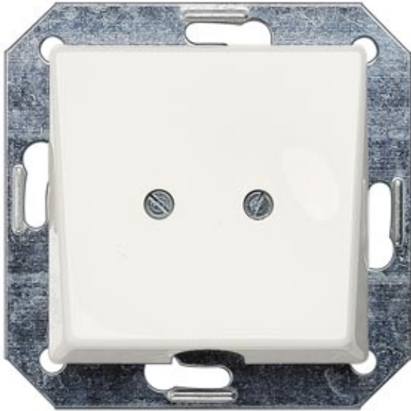
I-SYSTEM, TITANWEISS AUSLASSPLATTE, 55X55MM