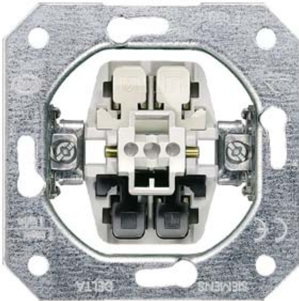
DELTA SCHALTER-GERÄTEEINSATZ UP, AUS-/WECHSELSCHALTER 10A 250V