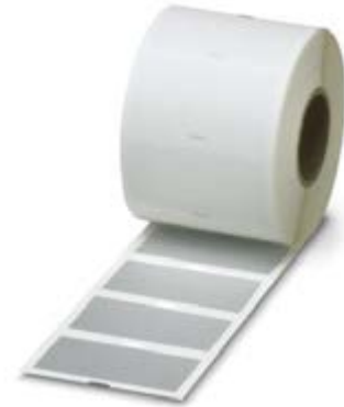
Abbildung zeigt Variante des Artikels

http://eshop.phoenixcontact.at/phoenix/treeViewClick.do?UID=0800356