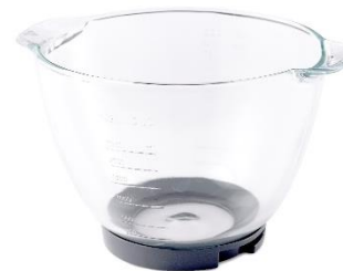
Inkl. einer 4,6 L Glasschüssel