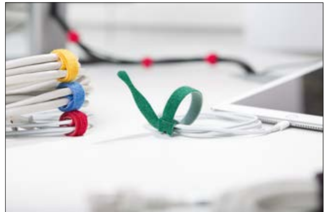
Durch das praktische Kabelbinderdesign kann der TEXTIE am Kabel verbleiben und geht nicht verloren.