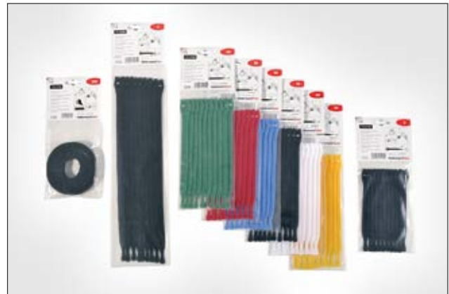
Die TEXTIE Serie ist in verschiedenen Farben und Längen erhältlich.