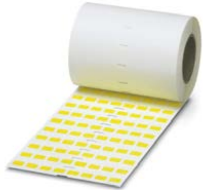
Abbildung zeigt die Produktvariante EML (20X8)R YE

http://eshop.phoenixcontact.at/phoenix/treeViewClick.do?UID=0816977