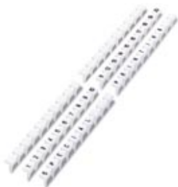
BNB-Zackband, 10-teilig, trennbar, längs bedruckt mit den fortlaufenden Zahlen: 1 ... 10, weiß

Bitte beachten Sie, dass die hier angegebenen Daten dem Online-Katalog entnommen sind. Die vollständigen Informationen und Daten entnehmen Sie bitte der Anwenderdokumentation. Es gelten die Allgemeinen Nutzungsbedingungen für Internet-Downloads. ( http://phoenixcontact.de/download )