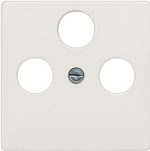
I-SYSTEM ABDECKPLATTE TV/RF/SAT 3-LOCH TITANWEISS