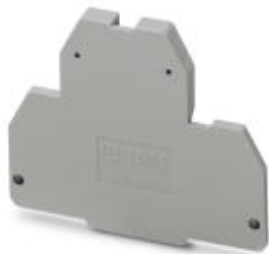
Distanzplatte, Länge: 44 mm, Breite: 2 mm, Farbe: grau

Bitte beachten Sie, dass die hier angegebenen Daten dem Online-Katalog entnommen sind. Die vollständigen Informationen und Daten entnehmen Sie bitte der Anwenderdokumentation. Es gelten die Allgemeinen Nutzungsbedingungen für Internet-Downloads. ( http://phoenixcontact.de/download )