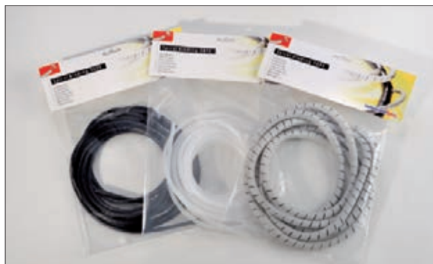
SBPE Spiralschläuche sind auch in praktischen 5-m-Längen erhältlich.

Spiralschläuche aus flammhemmenden Polyethylen finden Sie in unseren Branchenlösungen.