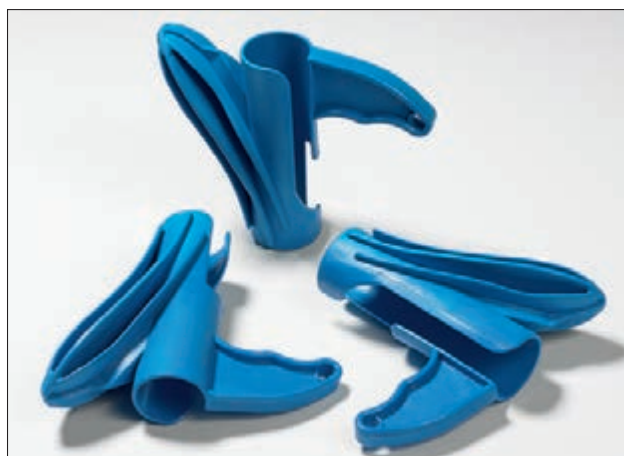
Aufziehwerkzeug HAT: erhältlich in 5 verschiedenen Größen.